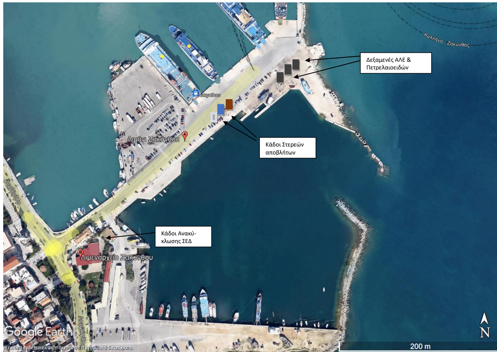
Σχέδιο παραλαβής και διαχείρισης αποβλήτων πλοίων και καταλοίπων φορτίου Λιμένα Ζακύνθου